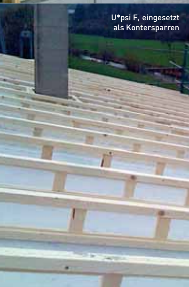
U*psi F, eingesetzt als Kontersparren