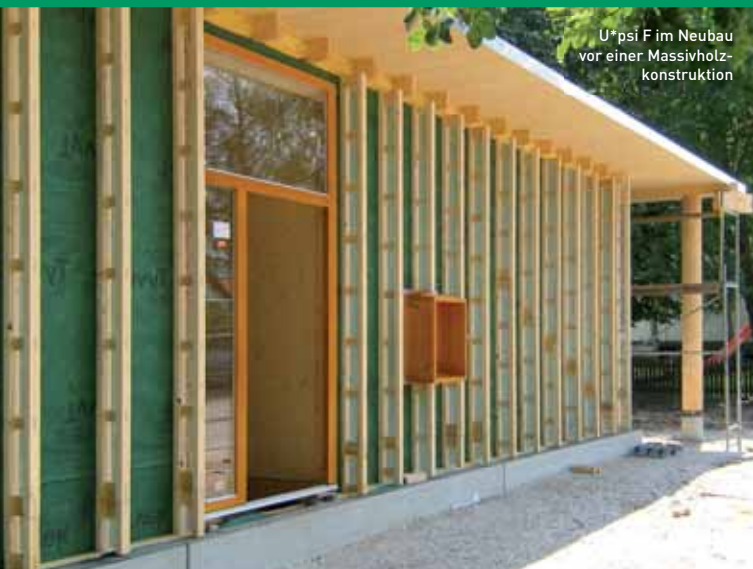
U*psi F im Neubau vor einer Massivholzkonstruktion

Hoch wärmegeklämt bauen und sanieren für die Standards von morgen.