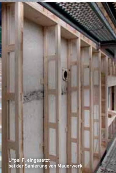
U*psi F, eingesetzt bei der Sanierung von Mauerwerk

Nicht gebrauchte Energie ist nicht nur am umweltfreundlichsten, sie ist auch die Preisgünstigste. Mit U*psi werden grosse Dämmstoffdicken einfach und praxisingerecht umgesetzt – als Unterkonstruktion für Fassade oder im Dach wie auch im tragenden Wandbauteil.