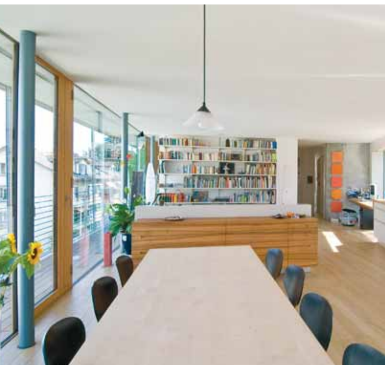
Oben links: Montage eines grossflächigen Deckenelements (max. 18 m x 2,50 m) (Untersichtvariante Weisstanne astrein, lebhaft) Oben rechts: Nach dem Verlegen der Installationen wird Kalksplitt in die Elementkammern gefüllt Mitte links: Decke mit Untersichtvariante Weisstanne astrein, Akustikleisten (Schule in Furtwangen, Arch.: Harter+Kanzler, Freiburg) Mitte rechts: Decke mit Untersichtvariante Fichte feinästig, geschlossen (Ausstellungsraum Schreinerei, Arch.: Strebek+Kiener, Schöffland) Unten links: Weit gespannte Decke mit verkleideter Untersicht (Mehrfamilienhaus, Arch.: Halle 58, Bern)